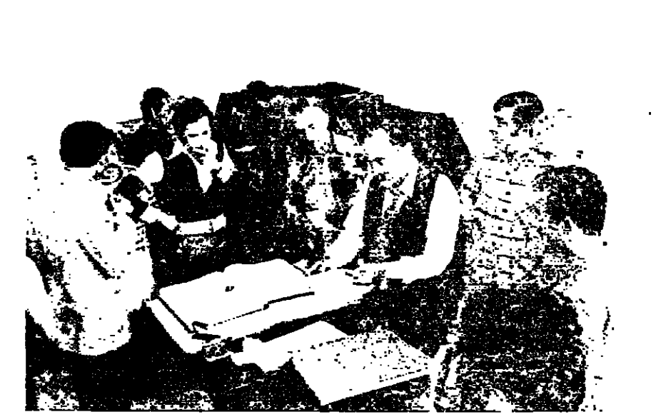
اتصال كتف في اليوم الاول